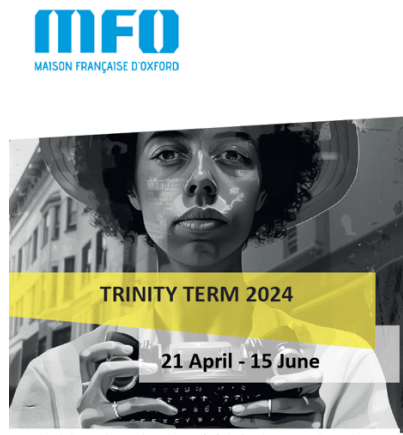
'Press the shutter, type the prompt. Photographs in times of artificial intelligence', 8 May 2024.