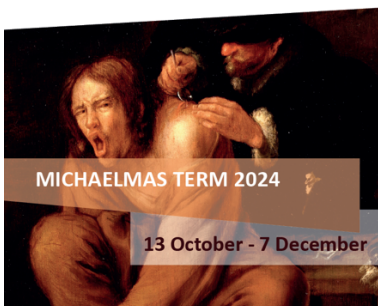
Exhibition 'Pain and the Physician, 16th-18th century', 14 Oct. 2024-14 March 2025 Painting by Gerrit Lundens, 1640s.