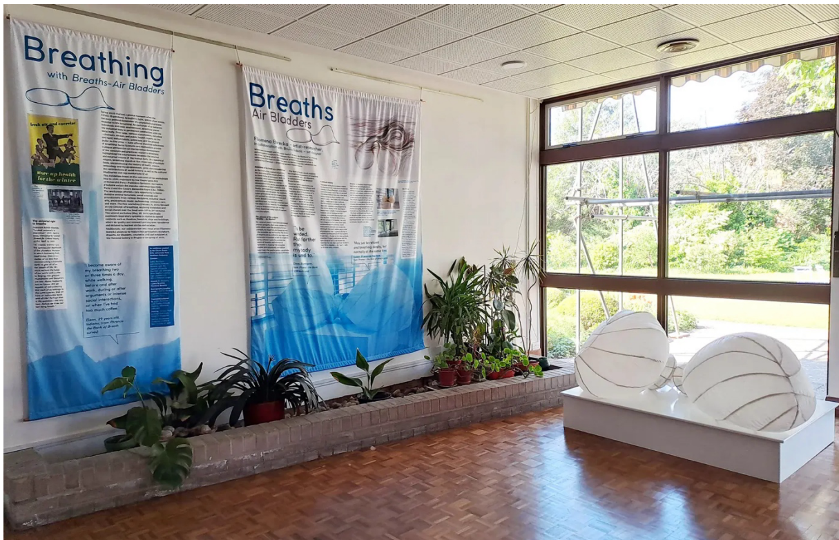
@Exposition Breathing à la Maison Française d'Oxford, 19 mai-26 juin 2025

Présenté au Conseil scientifique du 21 mai 2026