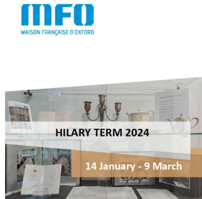
Display 'Gastronomy and Conviviality' at the Maison Française d'Oxford, Dec 2023 - January 2024

2-10 Norham Road, OX2 6SE | www.mfo.ac.uk communications@mfo.ac.uk