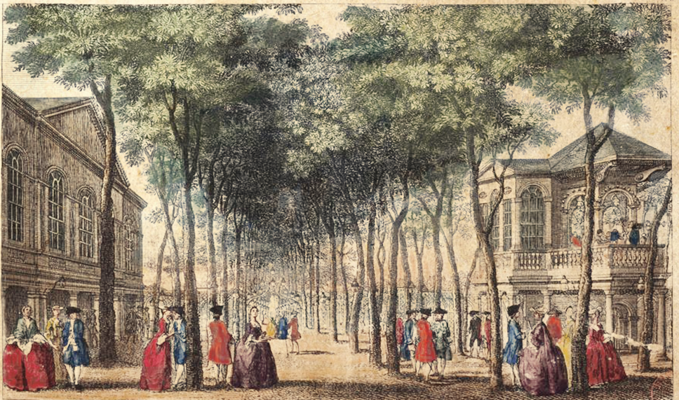
View of Marybone Gardens, showing the Grand Walk, and the Orchestra with the Musick. 1780s.